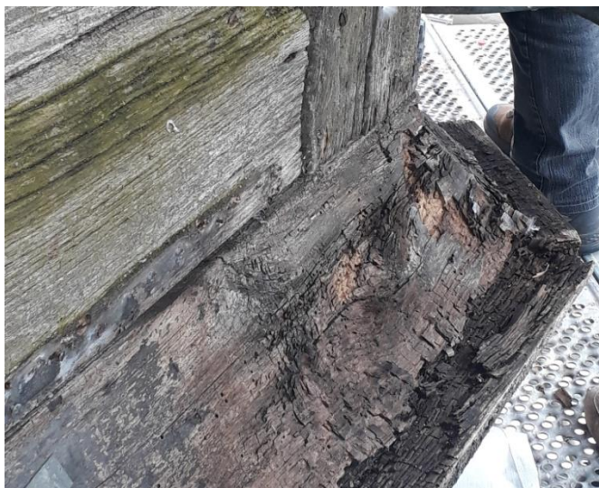
Exemple : avant (ci-dessus) et après (ci-dessous)

Les poteaux corniers habillés de planches et repris avec de la résine et d'autres travaux tels que le voligeage sont réalisés ou en cours, à ce jour.